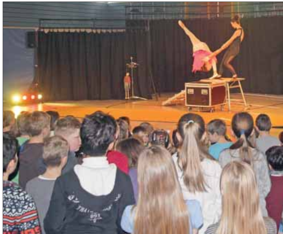
Die Aufführung des Artistenstudios Bautzen sorgte für Begeisterung. Das Programm war ein Geschenk des Vereins – ein Dankeschön des Vaters eines ehemaligen Schülers

Im Laufe der Arbeiten zeigte sich, dass die Sanierung des Altbaus umfangreicher ausfallen würde, als 2014 geplant. So wurden auf Anordnung der Denkmalschutzbehörde die Wandflächen nachträglich auf